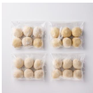
②冷凍生地のフライパンちぎりパンキット