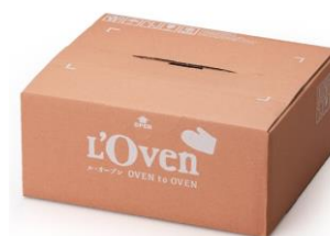
商品お届け時荷姿